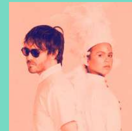
Bomba Estéreo Banda de música