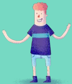
Niñas y niños